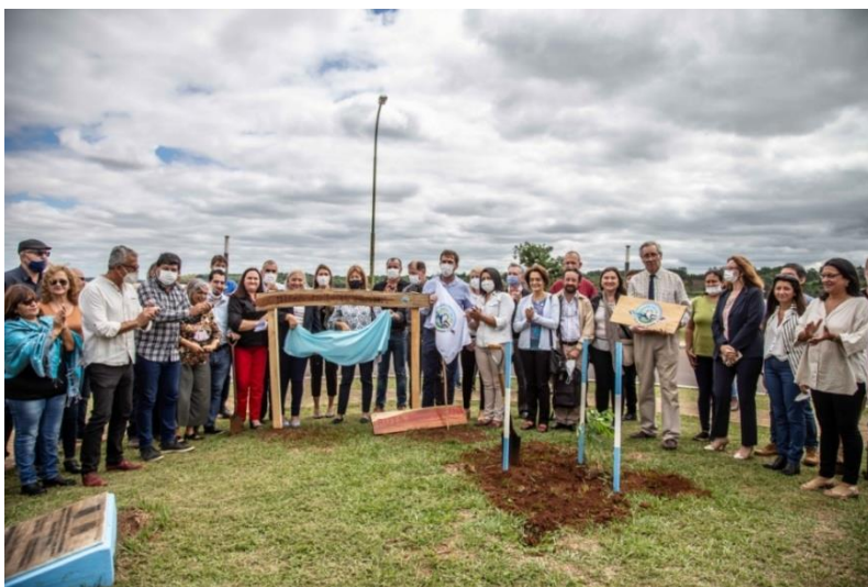
Costanera de Candelaria: plantación del clon del sarandí y descubrimiento del cartel de la ruta

Como resultado se apunta a la apropiación del tema por escuelas y otras instituciones del ámbito educativo del espacio al que hacemos referencia y consolidar un grupo de investigadores, estudiantes, funcionarios, empresarios y amantes de la historia y la cultura, que estén interesados por conocer el patrimonio del legado este héroe nacional en Misiones. 11