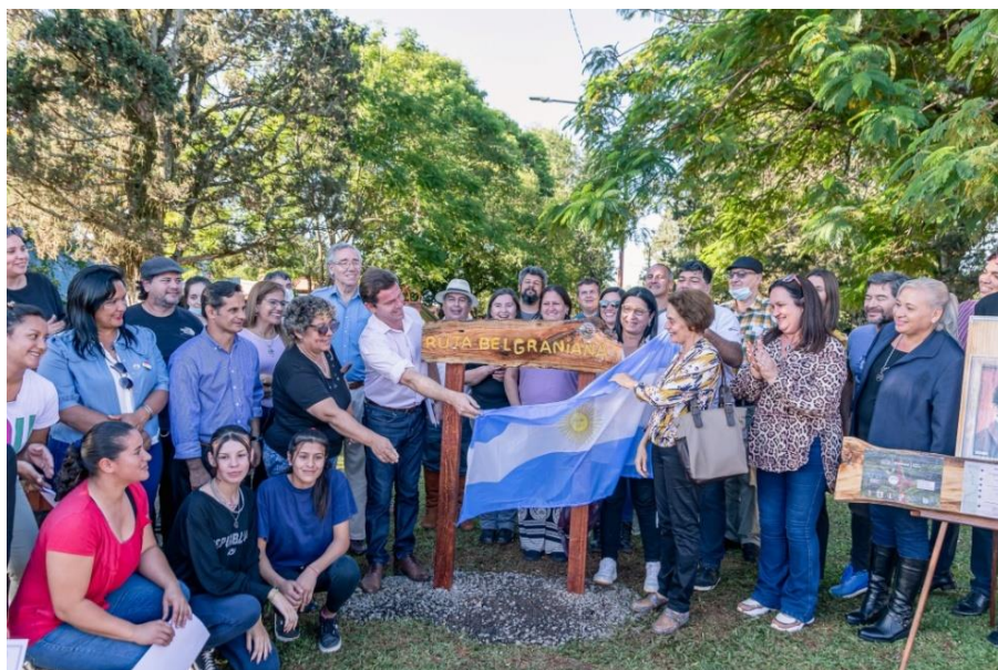
La señalización en San José

El patrimonio físico no adquiere todo su sentido sino a través de los valores inmateriales que contiene. Recuperar este paisaje cultural, implica revalorizarlo, descubrir los valores que encierra y que tienen que ver con la significativa presencia de Manuel Belgrano en suelo misionero.