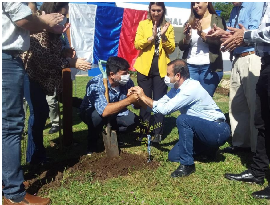
Fachinal: el Gobernador de Misiones y el Ministro de Cultura plantan el clon del sarandí histórico

Al llegar a Fachinal, las actividades de la Ruta Belgraniana, se unieron al festejo oficial por el 97º aniversario del municipio, que contó con la participación del gobernador de la Provincia, Oscar Herrera Ahuad, quien plantó el ejemplar clonado del sarandí histórico y descubrió el cartel de la ruta.