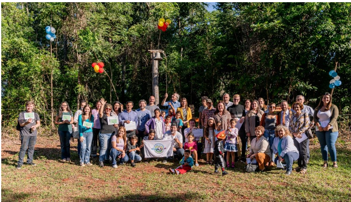
En San José con los niños